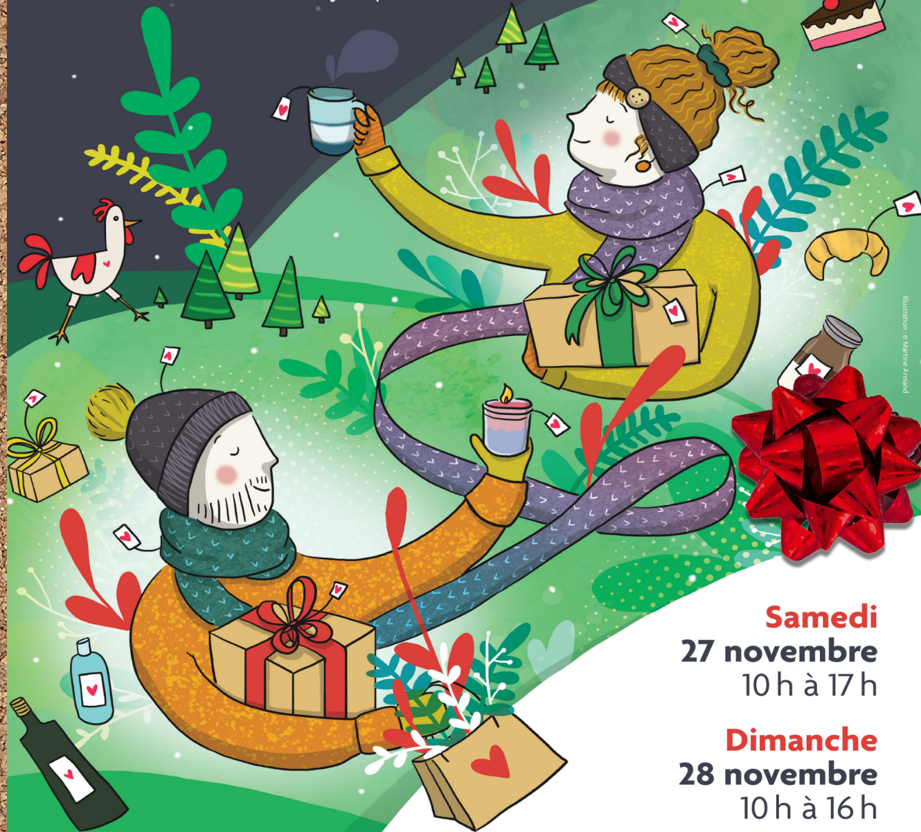
Illustration © Marine Armand

Vous y rencontrerez plusieurs nouveaux exposants et trouverez des tonnes de magnifiques idées cadeaux.