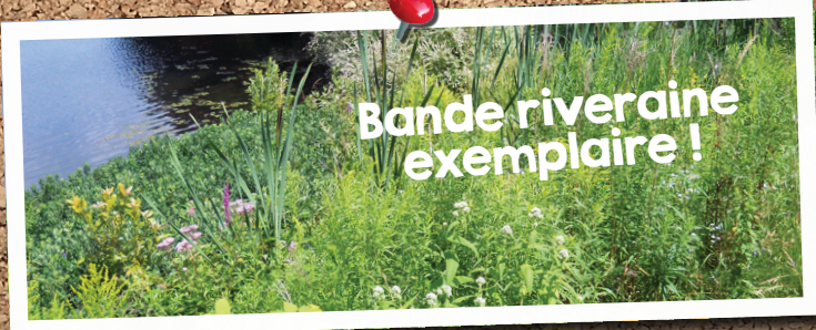
Bande riveraine exemplaire !