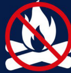
FEUX DE CAMP