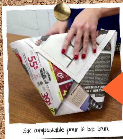
Sac compostable pour le bac brun.