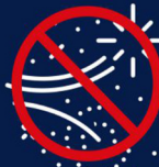
INSTRUMENTS PRODUISANT DES FLAMMECHES